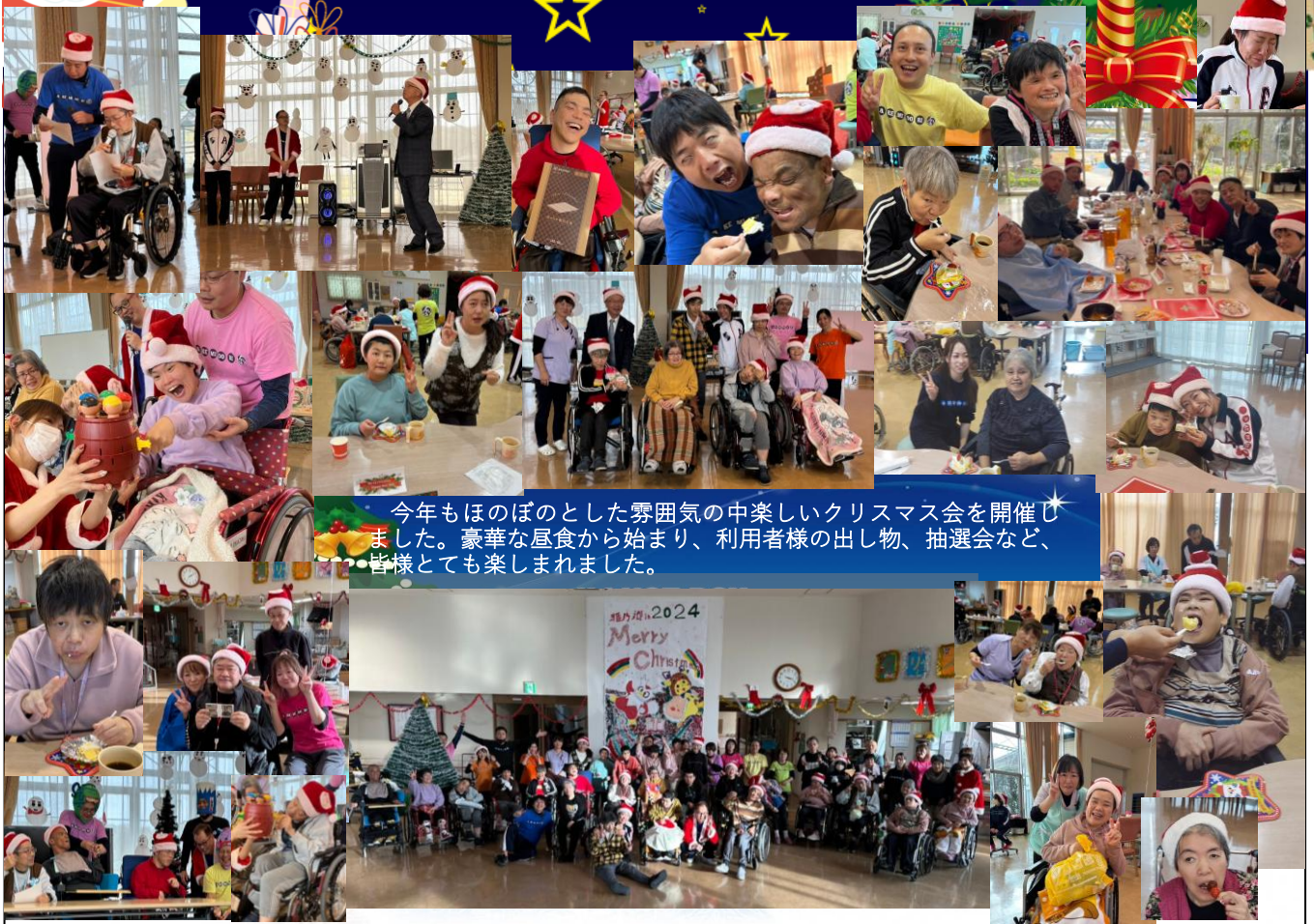
今年もほのぼのとした雰囲気の中楽しいクリスマス会を開催しました。豪華な昼食から始まり、利用者様のお出し物、抽選会など、皆様とても楽しめました。