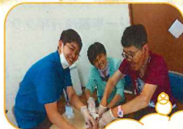
こねこね こねこね…