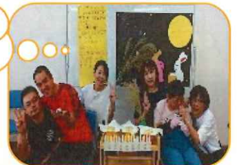
たくさんお団子 できました(´▽`)