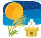
月見だんご作り 中秋の名月に合わせて お団子をつくりました！