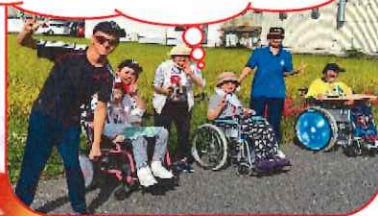
コスモスもきれい！