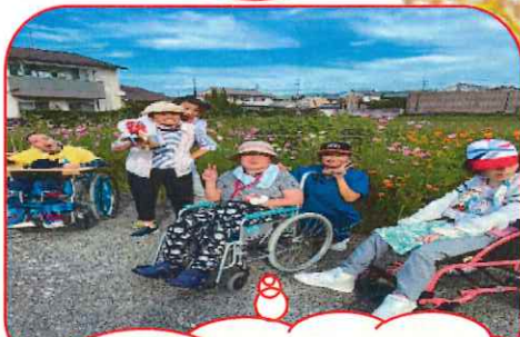
秋のお散歩 きもちいいですね😊